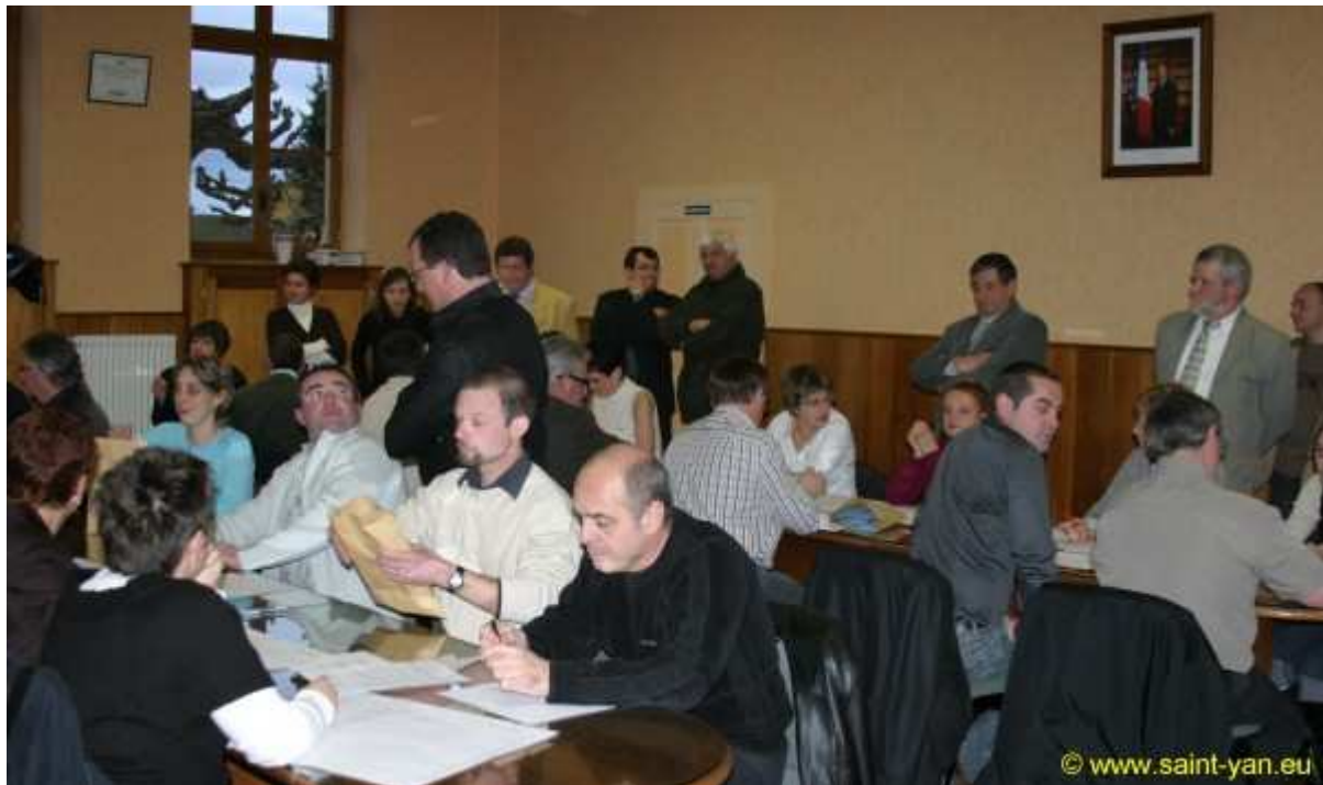
Le dépouillement lors du 1er Tour à la Mairie de Saint-Yan.