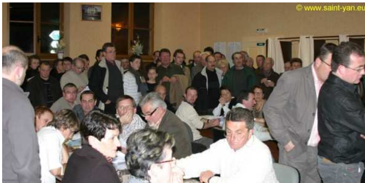
Les habitants de Saint-Yan sont venus nombreux pour connaître les résultats.

Il y aura donc un 2ème tour le 16 Mars 2008, où il y aura encore 3 sièges à pourvoir.