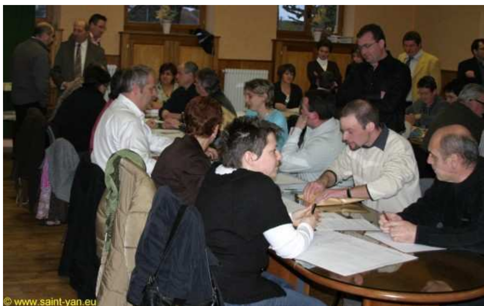
Le dépouillement à la Mairie de Saint-Yan.

Pas de surprise lors des Résultats du 9 Mars 2008